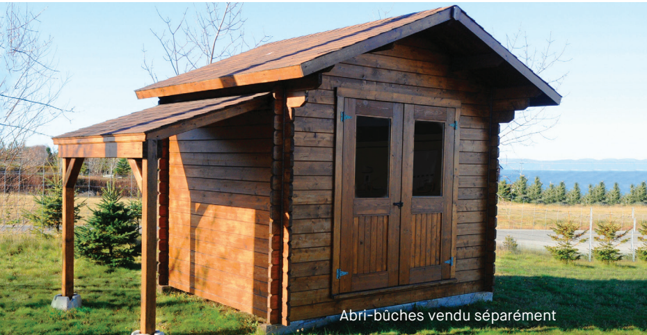
Abri-bûches vendu séparément